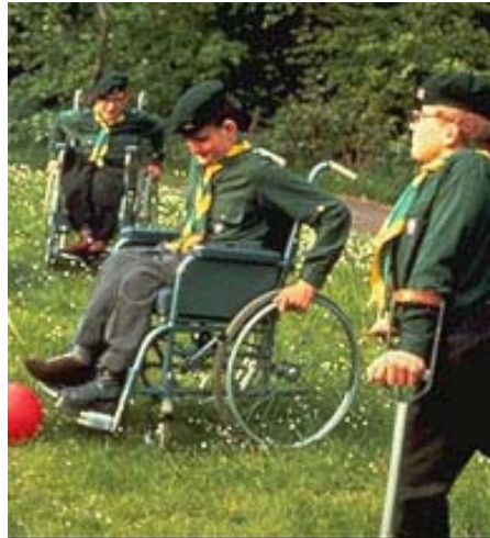
Escoteiros em atividade ao ar-livre

oportunidade de provar a si mesmos e aos outros que eles podem fazer coisas por si mesmos – e coisas difíceis também”