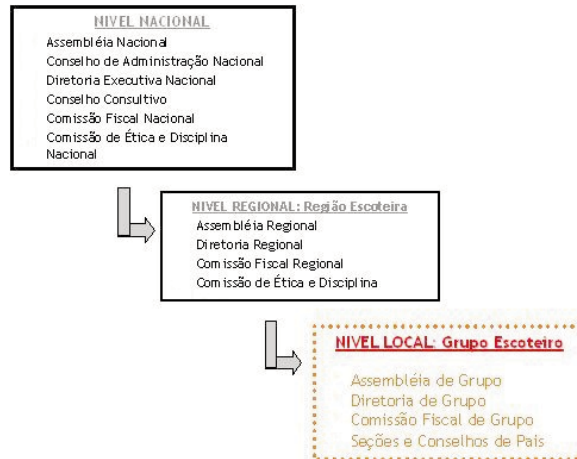
Figura 1 » Organograma e Estrutura do Escotismo no Brasil

Para compreender melhor a estrutura que abrange um Grupo Escoteiro, e importante saber que ele esta inserido dentro da um organograma mais amplo (figura 1), com instancias superiores responsáveis pela definição de diretrizes e aplicação de regulamentações necessárias para o desenvolvimento de atividades.